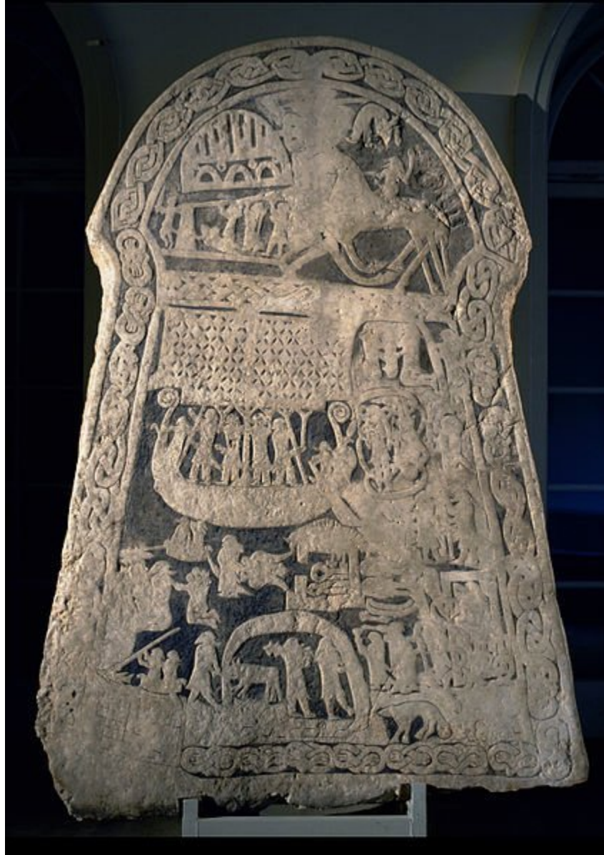
A pedra ilustrada Ardre VIII mostra Odin montando Sleipnir no topo.