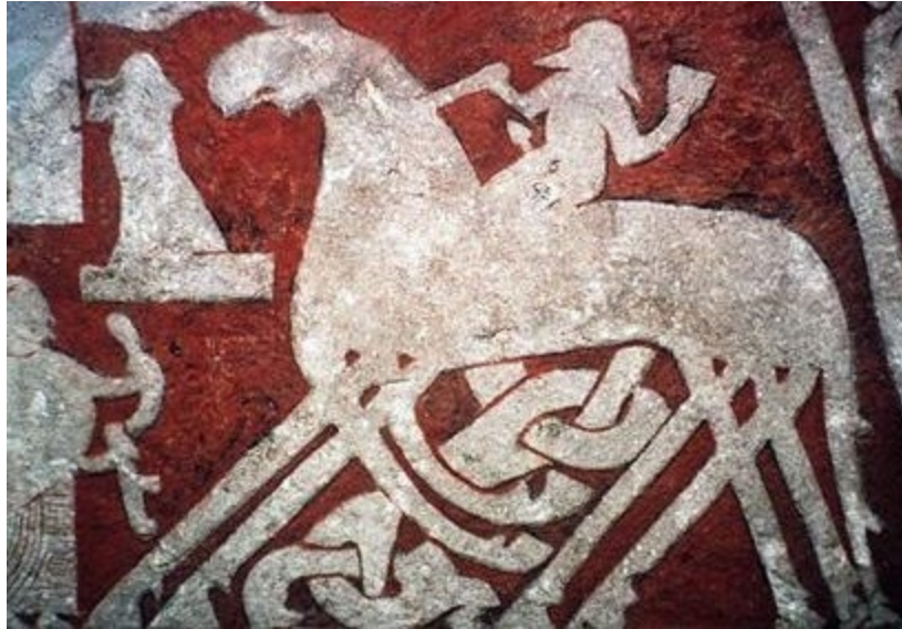
Ilustração em pedra medieval de Odin entrando no Valhalla

Por Jesse Harasta e Charles River Editora