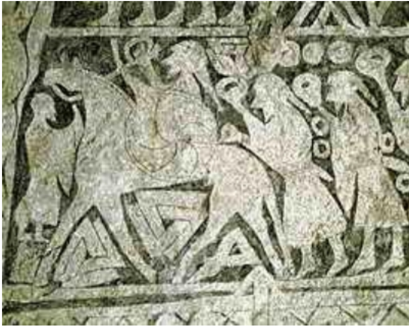
Ilustração do século VII mostrando Odin liderando guerreiros