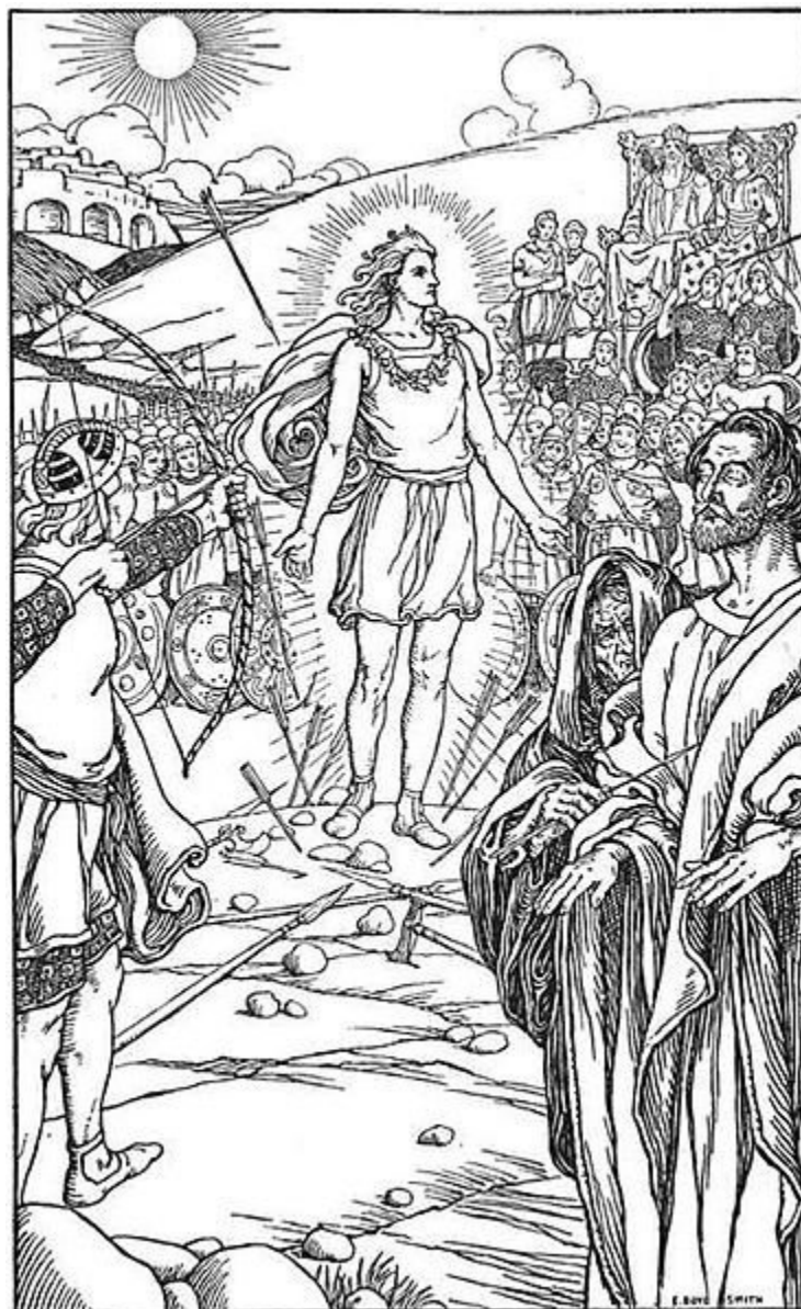
Ilustração mostra os deuses atirando flechas contra Balder, de Elmer Boyd Smith

Com a morte da beleza e inocência, o Crepúsculo começa. Aí entra o “Fimbulwinter”, três anos de inverno sem fim que assolam a humanidade, causando com que os reinos terrenos guerreiam entre si. As correntes que seguram os monstros do mundo são quebradas, e a Serpente de Midgard, o Lobo Fenris, e o Loki em pessoa constroem um exército de gigantes, monstros e seres infernais para destruir Asgard.