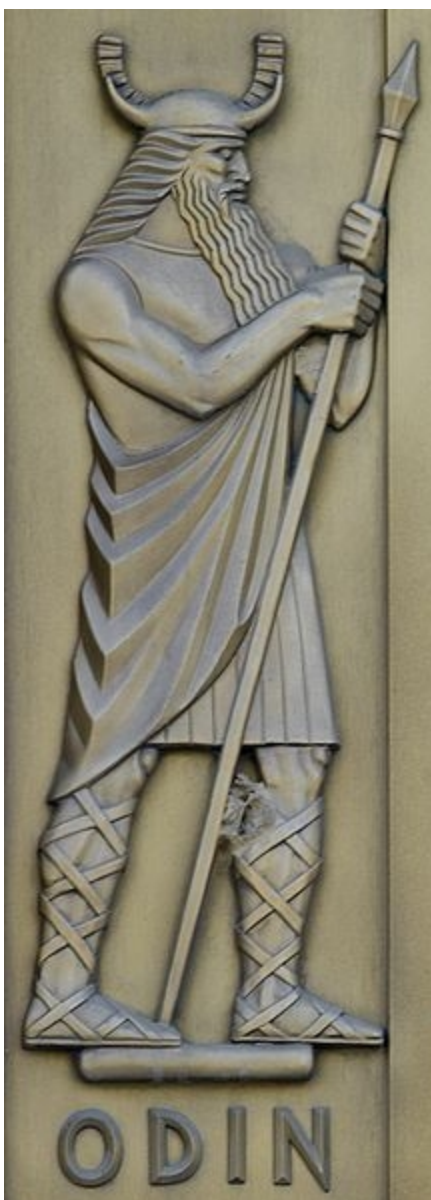
Ilustração de Odin e sua lança no Prédio da Biblioteca do Congresso

Por fim, uma das posses importantes de Odin é o seu lar, Valhalla, o “Castelo dos Mortos”. Esse imenso palácio se localizava em um bosque chamado Glasir e tinha 540 portas. Suas paredes eram feitas de lanças, e seu teto de escudos. Seus habitantes, 800 dos maiores guerreiros da história humana, passavam as noites banquetecendo-se sob seu teto, enquanto que durante o dia eles batalhavam entre si, como uma forma de se preparar para o Ragnarök. Odin os revivia todas as noites para suas celebrações. [18] Estes mortos eram coletados dos campos de batalha onde caíram pelas Valquírias, “Donzelas de Batalha” que servem a Freya.