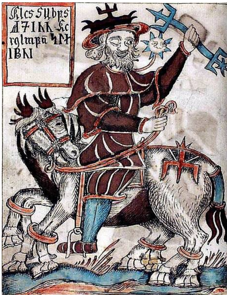
Manuscrito islandês do século XVIII ilustrando Odin cavalgando com Sleipnir

Outro dos vários nomes de Odin é “Biflindi”, que significa “aquele que empunha uma lança”. Esse nome deve-se à sua posse da lança Gungnir. Gungnir foi fabricada pelos anões, e em alguns contos relata-se ser oriunda de um dos galhos da Yggdrasil (a Árvore do Mundo), e apresentada para Odin como uma prenda de Loki durante a mesma competição de troca de presentes em que Thor recebeu seu martelo. [17]