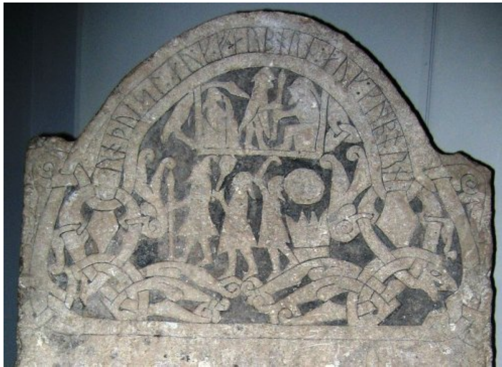
Uma pedra rúnica medieval mostrando Odin, Thor e Freyr.

conhecido como Baldr) era o mais belo dos deuses, e foi a sua morte, que segundo escreveu Snorri foi causada por uma das trapaças de Loki, que causou Ragnarok, a batalha apocalíptica que conclui o reinado de Odin.