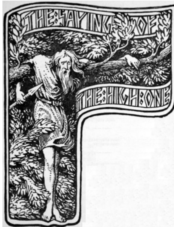
Ilustração do Sacrifício de Odin de W.G. Collingwood (1908)

Outro tema comum das histórias de Odin é sua habilidade de se disfarçar e passar por entre os humanos, gigantes e deuses sem ser reconhecido. Por exemplo, no poema Hárbarðsljóð da Edda Poética , Odin se disfarça como um barqueiro chamado “Barba Cinza” e debate com Thor a respeito de levá-lo através de um lago. Os dois entram em uma troca ritualizada de poemas, e Odin claramente vence o deus da guerra. Ele também aparece disfarçado em um concurso de poesia com um sábio gigante, e na Skáldskaparmál 5 da Edda Prosaica , ele se disfarça de um trabalhador para roubar o Hidromel da Poesia, que confere o dom da poesia a qualquer um que o beber.